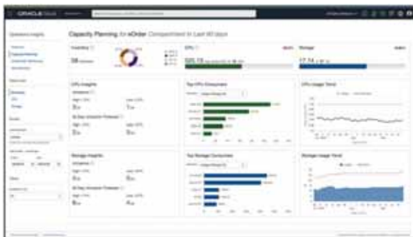
Рис. 4. Компонент Operations Insights

Психологический вызов для администратора СУБД – перестроить свое внутреннее мировоззрение относительно обслуживания СУБД. Администратору больше не нужно контролировать рутинные работы по обслуживанию БД. Работа администратора теперь схожа с работой инженера devops или архитектора информационной системы. А это потребует новых знаний, профессиональных навыков, широты кругозора и готовности меняться. ■